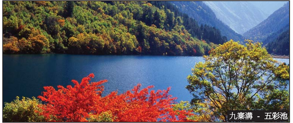
九寨溝 - 五彩池